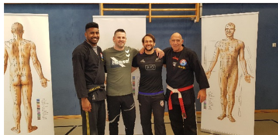
Selbstverteidigungskurs am Portfoliotag

vier Wochenstunden in Klasse 5 und 6 AGs: Akrobatik, Rugby, Tanz ausgebildete Sporthelfer einwöchige Sportfahrt in Klasse 9 schulinterne Turniere Teilnahme an Sportwettbewerben Sport-Aktions- und Gesundheitstage bewegungsreiche Pausengestaltung Mittagspausenspiele Präventionsprogramm Fit4future teens gesunde, abwechslungsreiche Pausen- verpflegung im Café Luise